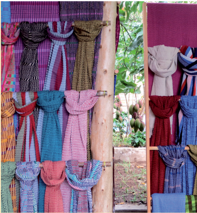
Designer grafic: © Regina Schneider